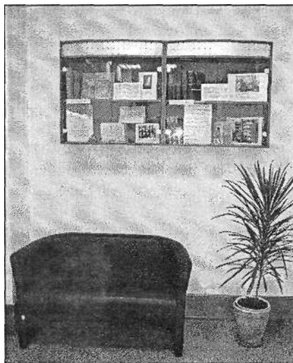
Для подуставшего читателя — уголок релаксации. Отдохните, пожалуйста!

А может, именно это мало кем замечаемое обстоятельство и породило исподволь современную метафору-определение, бытующую среди наших читателей: «Библиотека — фабрика интеллекта...» И ведь звучит!