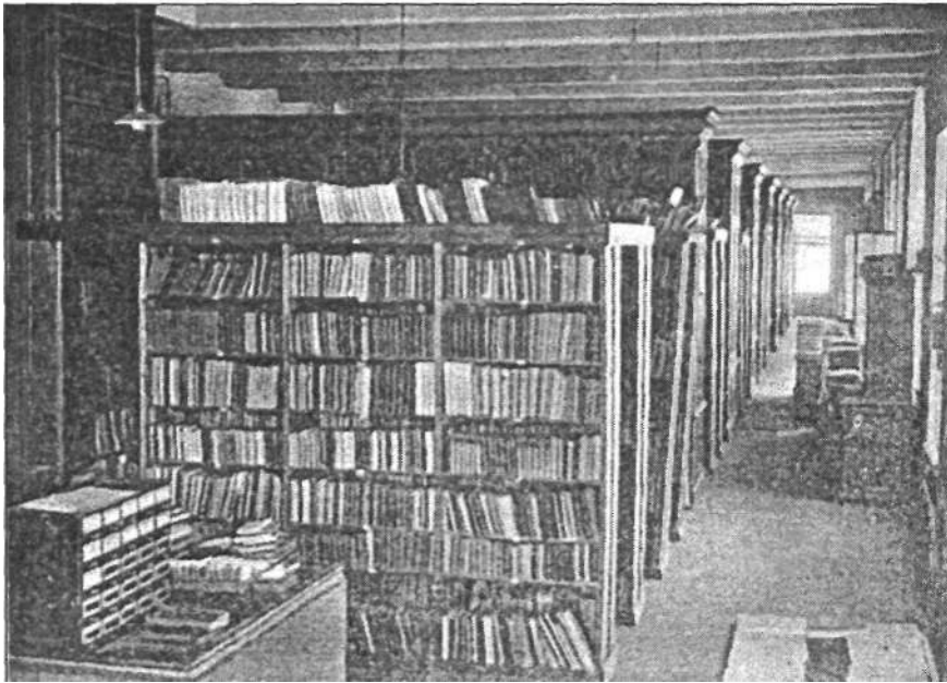
Святая святых — книгохранилище. Фото 1930-х гг.

шенно непригодном помещении — в фабричном корпусе, где, разумеется, поначалу не было ни учебных аудиторий, ни мастерских, ни лабораторий. Однако уже в 1931 г. началось строительство главного корпуса («А»), и к началу 1934/1935 учебного года институт переехал в новое здание. Библиотеке выделили одну комнату — в ней находилось книгохранилище и здесь же производились обработка и выдача книг. Читального зала не было, лишь в общежитии имелась комнатка с передвижкой, в фонде которой были представлены учебники и беллетристика. Все же и в этих условиях библиотека стремительно развивалась. Уже на первое января 1935 г. ее фонд составлял около тридцати тысяч экземпляров, число читателей — 979, штат — 3,5 единицы.