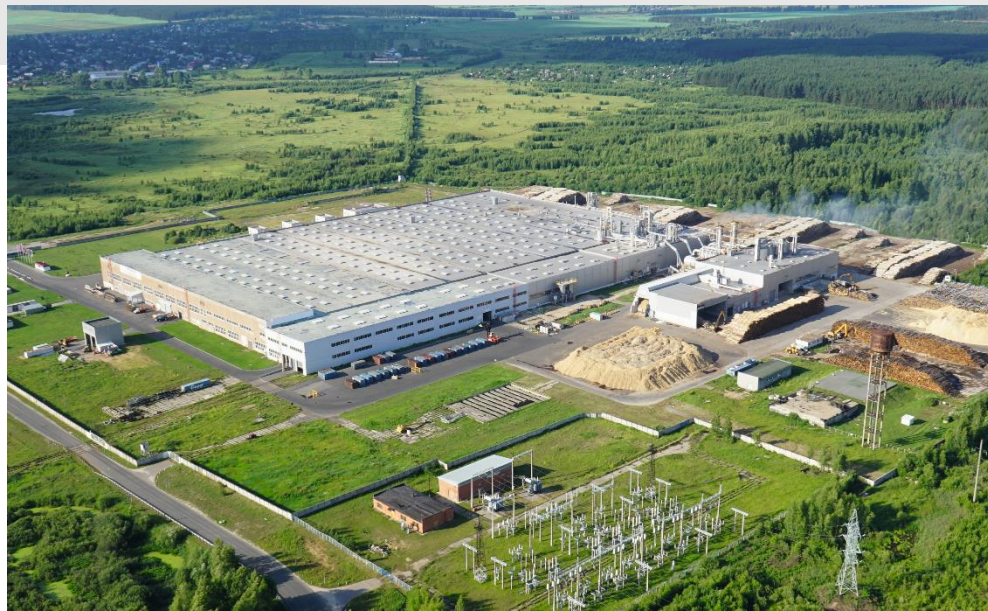
Завод EGGER в г. Шуя