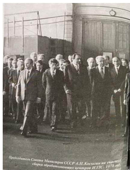
Председатель Совета Министров СССР А.Н.Косыгин на учредительной сессии обрабатывающих центров ИЭТС. 1978 год.