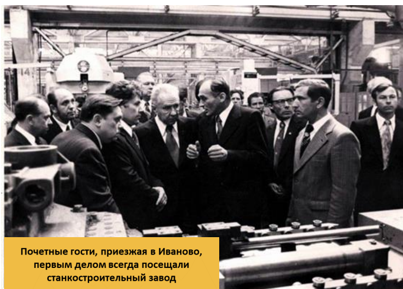
Почетные гости, приезжая в Иваново, первым делом всегда посещали станкостроительный завод